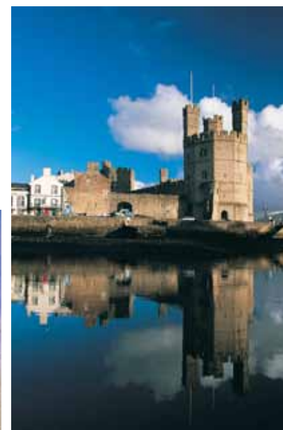
Clocwedd o'r dde uchod: Pentref Eidalaid Portmeirion; Castell Caernarfon; rheilffordd fyd-enwog yr Wyddfa; Pont Menai.