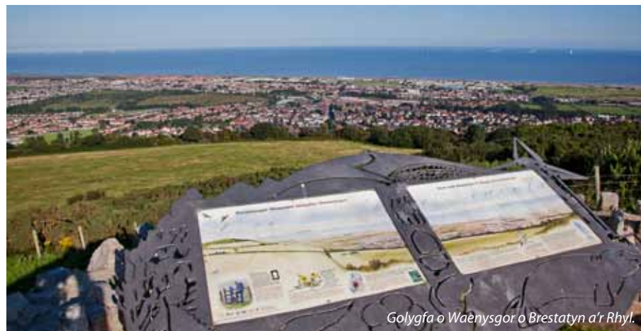
Golygfa o Waenysgor o Brestatyn a'r Rhyf.

I'r dwyrain, yng Ngororau Gogledd Cymru, rhoesom arian ar gyfer taflenni atyniadau newydd yn ogystal â helpu i ddatblygu llyfrgell ffotograffau wedi ei huwchraddio o'r cyrsiau golff.