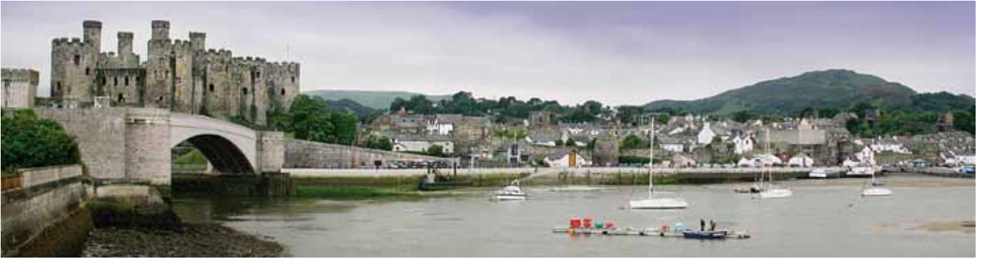
conwy trefi caerog